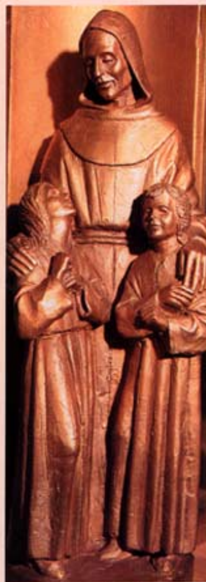
Protettore dei bambini

I frati del Santuario e delle Marche ringraziano di cuore tutti coloro che hanno collaborato con la loro offerta, piccola o grande. Ogni 28 del mese preghiamo per i benefattori, il Signore e San Giacomo vi protegga e vi ricompensi con la sua grazia!