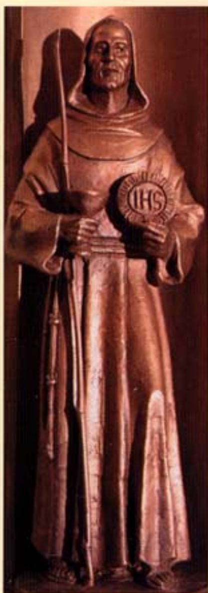
Il Nome di Gesù.